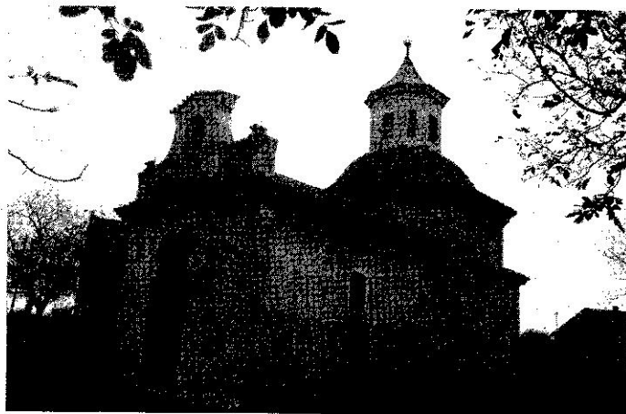
KAPLE sv. Jana Nepomuckého – celkový pohled.

Úspěšně osadit se je podařilo v uplynulém týdnu. „V této aktivitě nám hodně pomohl i Obecní úřad Hospozín, který přispěl svým podílem k dotaci ve výši 12 500 korun,“ uzavřela místopředsdkyně spolku.